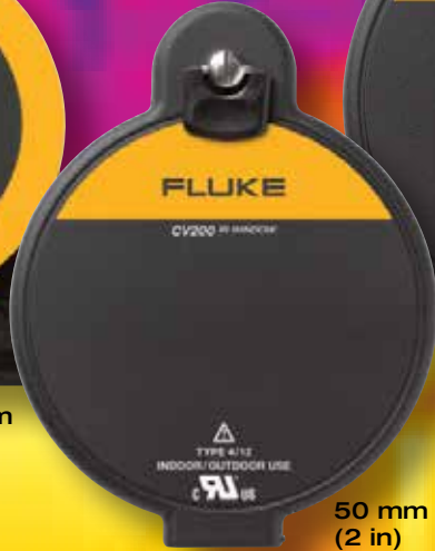
50 mm (2 in)