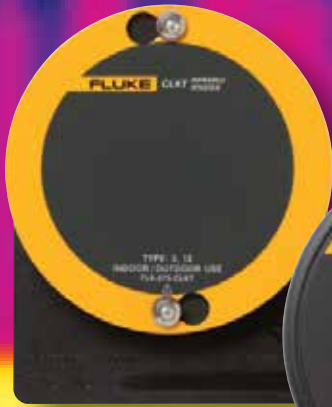
100 mm (4 in)、75 mm (3 in) 及 50 mm (2 in)