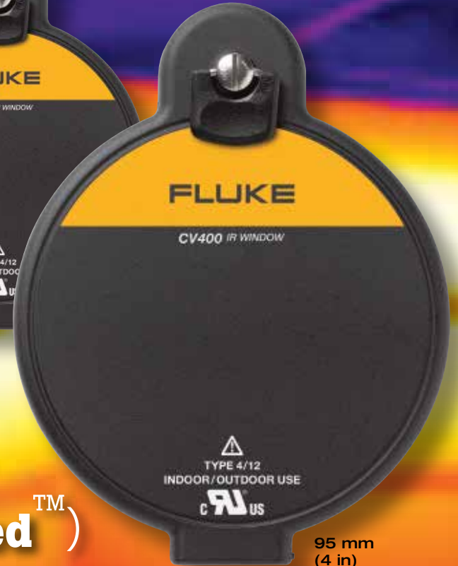
95 mm (4 in)