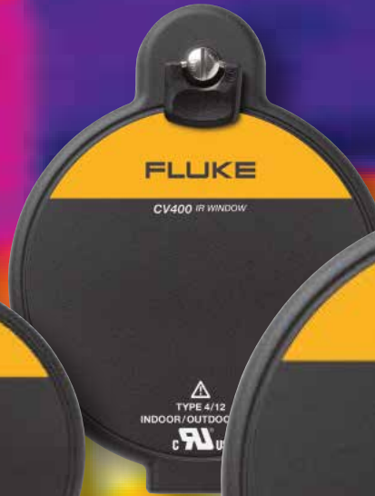
75 mm (3 in)