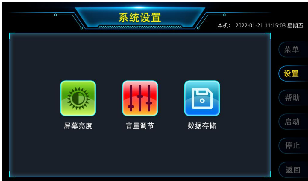
图 7 系统设置

通过触控或按键操作【设置】按钮，仪器进入如图 7 所示的系统设置功能界面。该界面可触控进入屏幕亮度、音量调节、数据存储界面。