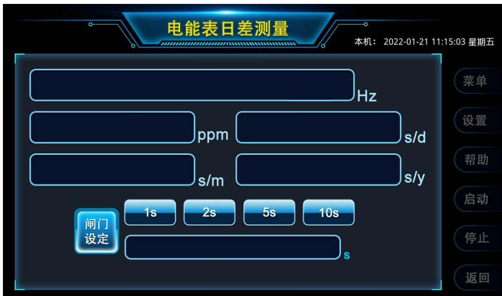
图 4 电能表日差测量界面

通过触控图 2 功能界面中的【电能表日差】，仪器进入如图 4 所示的电能表日差测量功能界面。将外部 1Hz 信号接到仪器的 CH1 接口，即可选择、设定闸门时间，触控或按键操作【启动】按钮，开始测量。所测数据将显示在触摸屏的相应位置，包括频率、ppm、日差、月差、年差。闸门时间可通过按键直接选择“1s”、“2s”、“5s”或“10s”，如果要输入其它闸门时间值，可通过按键下面的文本框直接输入相应的数字即可。如果想要选择其它测试功能，可触控或按键操作【返回】按钮，即可返回首页。