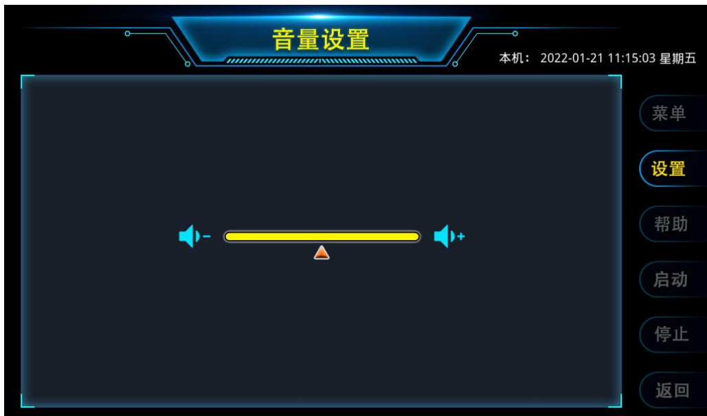
图 9 音量设置

通过触控图 7 系统设置界面中的【音量调节】，仪器进入如图 9 所示的音量设置界面。音量的初始数值为 0，此时音量最低，向右拖动滑块，音量逐渐增加，实际使用时，建议将音量调节至耳朵舒适的范围即可。