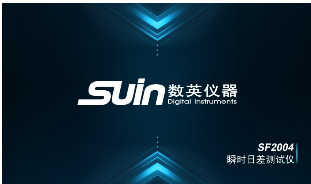
图 1 开机界面