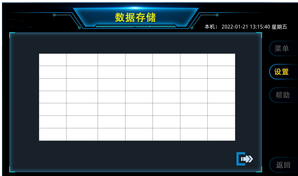
图 10 数据存储