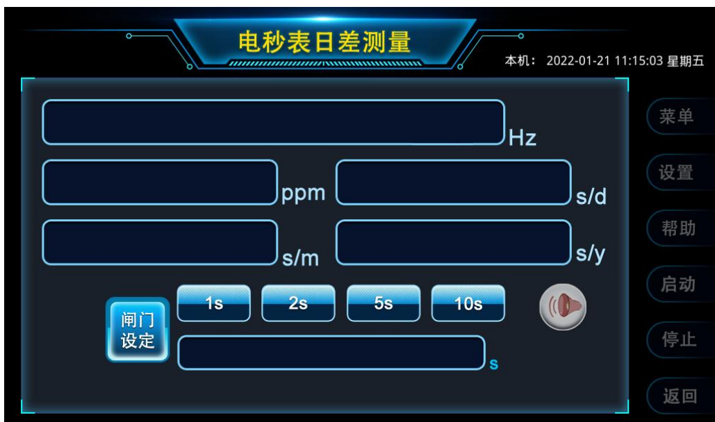
图3 电秒表日差测量界面