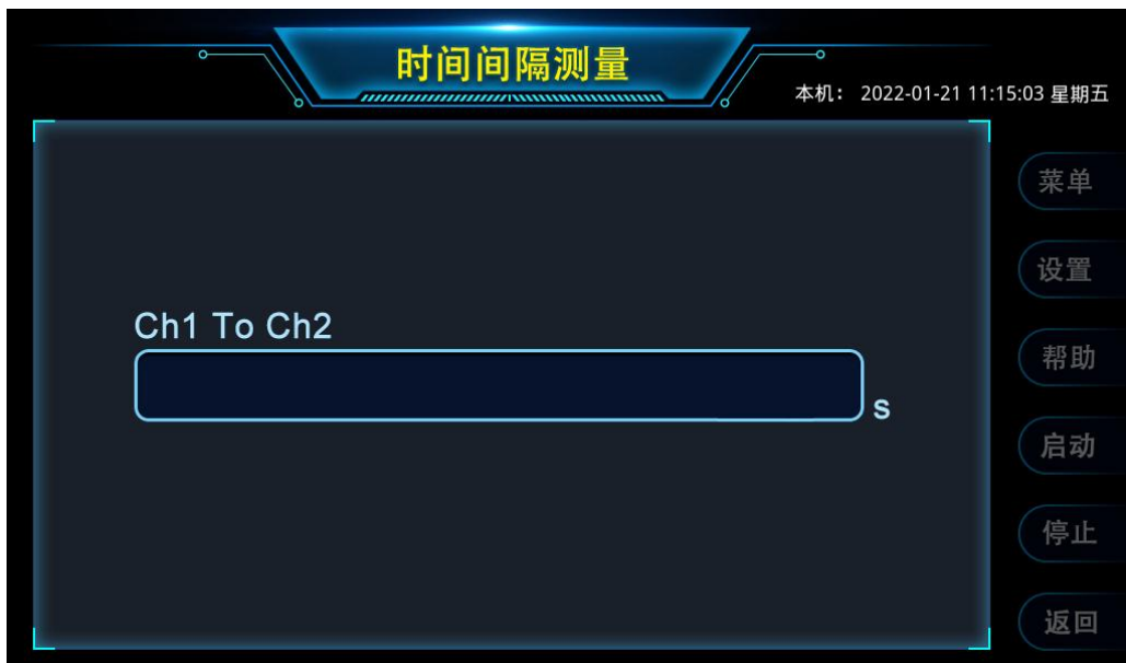
图 6 时间间隔测量

通过触控图 2 功能界面中的【时间间隔测量】，仪器进入如图 6 所示的时间间隔测量界面，在 CH1 和 CH2 输入接口接入 TTL 电平的信号，触控或按键操作【启动】按钮，开始测量。仪器测量以 CH1 输入的信号作为开始，以 CH2 输入的信号作为停止，最终显示开始到停止的时间差。时间间隔的测量分辨力为 5ns。