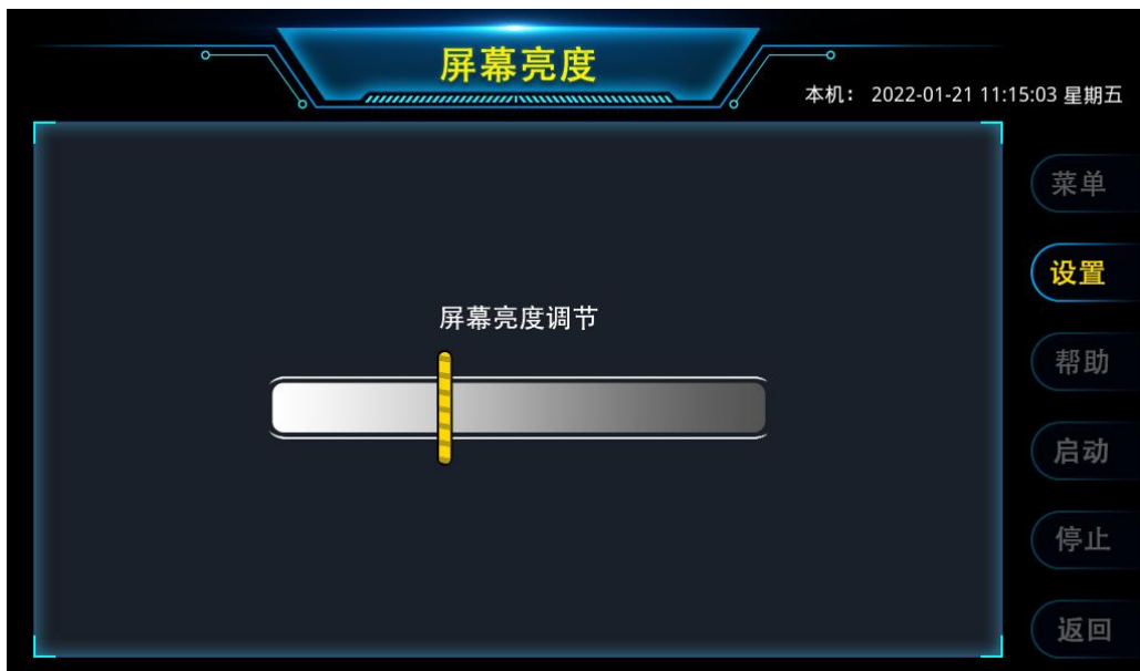
图 8 屏幕亮度

通过触控图 7 系统设置界面中的【屏幕亮度】，仪器进入如图 8 所示的屏幕亮度设置界面。亮度的初始数值为 0，此时屏幕的亮度为最高，向右拖动滑块，屏幕亮度逐渐变暗直到全黑，实际使用时，建议将亮度调节至眼睛舒适的范围即可。