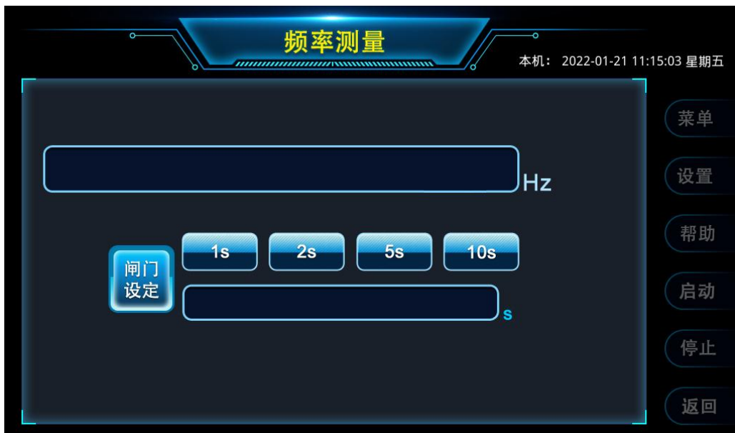
图 5 频率测量界面

通过触控图 2 功能界面中的【频率测量】，仪器进入如图 5 所示的频率测量功能界面。将外部信号接到仪器的 CH1 接口，即可选择、设定闸门时间，触控或按键操作【启动】按钮，开始测量。所测频率数据将显示在触摸屏的相应位置。闸门时间可通过按键直接选择“1s”、“2s”、“5s”或“10s”，如果要输入其它闸门时间值，可通过按键下面的文本框直接输入相应的数字即可。如果想要选择其它测试功能，可触控或按键操作【返回】按钮，即可返回首页。