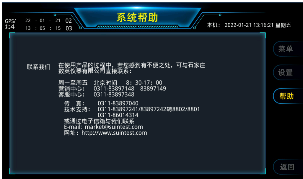
图 11 系统帮助