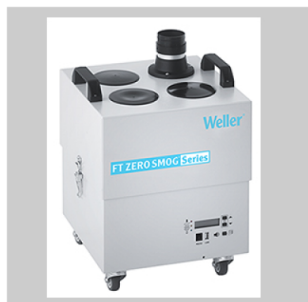
Fume extraction devices